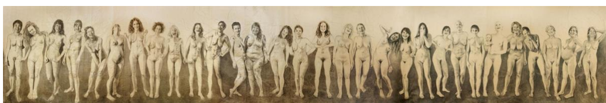
Œuvre de Mylène BESSON