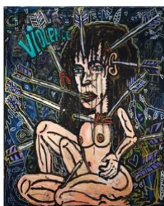
Œuvre de Robert COMBAS