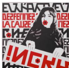
Œuvre de Mychel BLANC