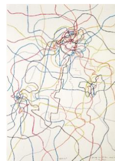
Œuvre de Gérard FROMANGER